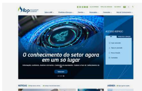
Novo portal do IBP

Outro marco do ano foi o lançamento do novo portal do IBP , totalmente reformulado para oferecer uma experiência de navegação mais moderna, dinâmica e intuitiva. A nova plataforma reúne análises do setor, notícias, publicações técnicas, cursos e eventos em um ambiente integrado. O site também passou a contar com o Hub de Conhecimento, espaço que concentra conteúdos estratégicos como "Entenda o Setor", "Observatório do Setor" e materiais técnicos de referência para a indústria.