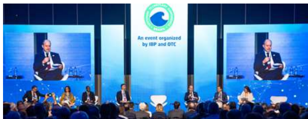
OTC Brasil 2025

Como parte da programação preliminar, criada para ampliar as oportunidades de networking e integração entre os participantes, o evento contou também com a realização da primeira Feijoada in Rio – OTC Brasil.