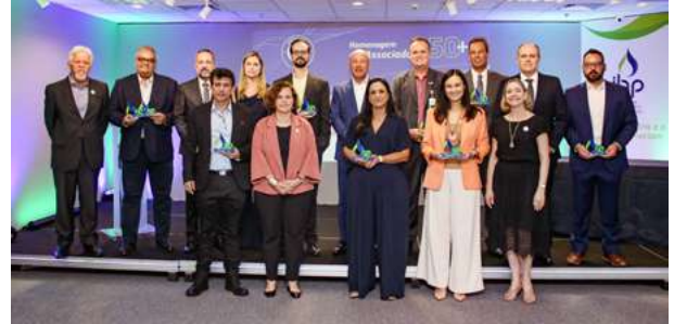
Celebração das empresas com mais de 50 anos de associação com o IBP

No coquetel de encerramento de 2025, o IBP homenageou empresas com mais de 50 anos de associação ininterrupta, celebrando trajetórias construídas com base em confiança e atuação conjunta. As empresas receberam reconhecimento público por sua contribuição histórica ao Instituto e ao setor.