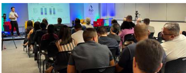
27º Encontro de Asfalto

No eixo técnico-operacional, destacaram-se o 27º Encontro de Asfalto, com foco em sustentabilidade na pavimentação, e o Fórum Técnico de Inspeção, que reuniu empresas como Shell, Modec e SBM para debater novas tecnologias.