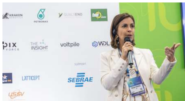
iUP Innovation Connections 2025

A avaliação média dos eventos foi de 9,3 com mais de 75 mil visualizações no Instagram, fortalecendo o posicionamento institucional.