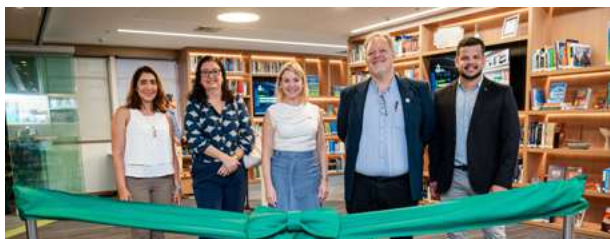
Inauguração da nova Biblioteca IBP