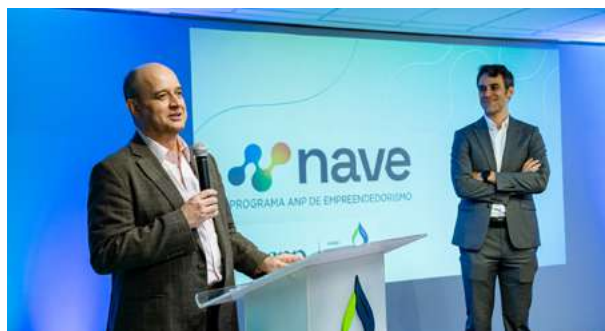
Programa Nave 2025