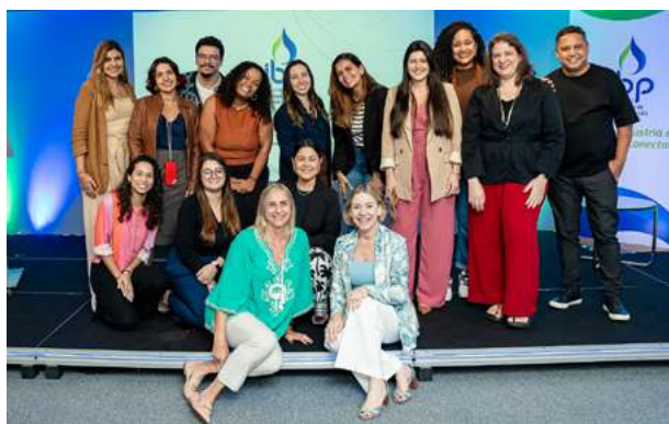
Evento de lançamento da nova identidade visual do IBP

Em 2025, a área de Comunicação e Marketing reforçou seu papel estratégico na ampliação do diálogo com públicos de interesse e no fortalecimento da imagem institucional do IBP. A atuação da área esteve diretamente conectada às agendas prioritárias do setor, apoiando o posicionamento do Instituto em temas relevantes do debate público e ampliando a presença institucional em canais proprietários, imprensa e plataformas digitais.