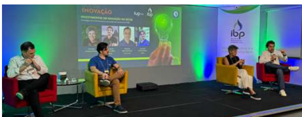
Dia da Inovação 2025

Em 2025, a área de Tecnologia e Inovação consolidou o IBP como articulador estratégico do ecossistema de inovação em óleo, gás e biocombustíveis. Por meio do iUP – hub de inovação do Instituto – e da gestão do Programa NAVE, a área ampliou conexões, estruturou inteligência coletiva e impulsionou soluções voltadas à transição energética, digitalização e segurança operacional. O ano foi marcado pela ampliação de impacto, expansão internacional e reconhecimento nacional.