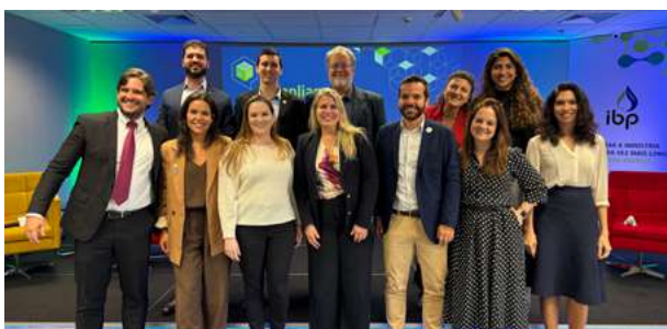
3ª edição do Compliance Talks

A 3ª edição do Compliance Talks , promovida pela Comissão de Compliance do IBP, consolidou o evento como fórum institucional recorrente de debate qualificado sobre integridade, conformidade e temas emergentes relevantes para o setor, ampliando seu alcance e participação em relação às edições anteriores.