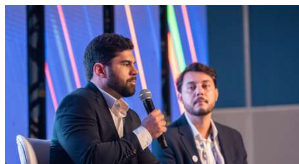
Rio Pipeline & Logistics 2025

Já o estudo 'Panorama dos investimentos em infraestrutura de dutos e logística no setor de O&G no Brasil', apresentado na Rio Pipeline & Logistics 2025, trouxe diagnóstico detalhado sobre gargalos e perspectivas de expansão, contribuindo para o debate sobre eficiência logística e segurança energética.