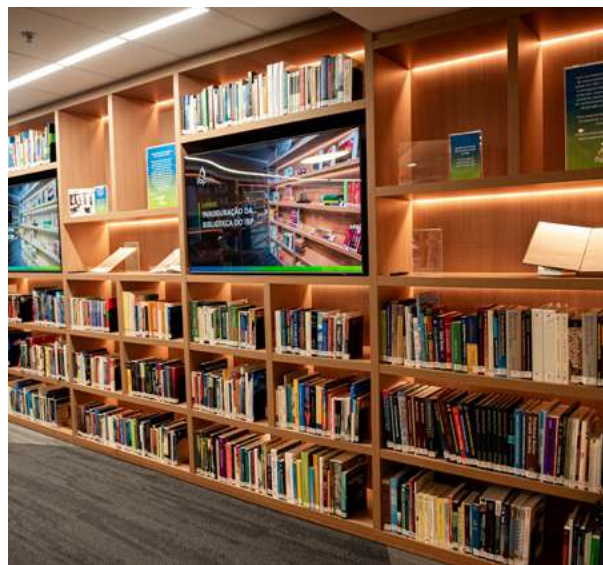
Nova Biblioteca IBP

O IBP reafirmou o seu papel como articulador técnico da indústria, mobilizando voluntários, associados, academia e parceiros institucionais na construção de referências que fortalecem a competitividade e a sustentabilidade do setor energético brasileiro.